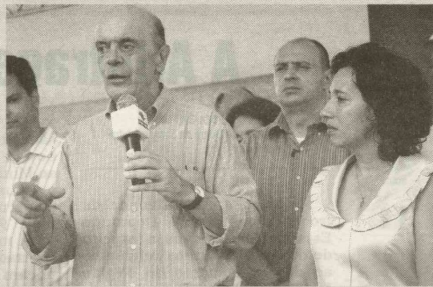
Em Guarujá, o governador José Serra inaugurou a Estação de Tratamento de Esgoto (ETE), em Vicente de Carvalho, que beneficiará oito bairros do Distrito e um conjunto habitacional

Segundo o superintendente regional da Unidade