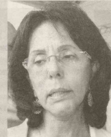
DILMA PENA – "Vamos chegar no final de 2011, 2012, com 100% do esgoto coletado e tratado"

A Sabesp disponibiliza o 0800-550195, para pedidos de ligação de esgoto.