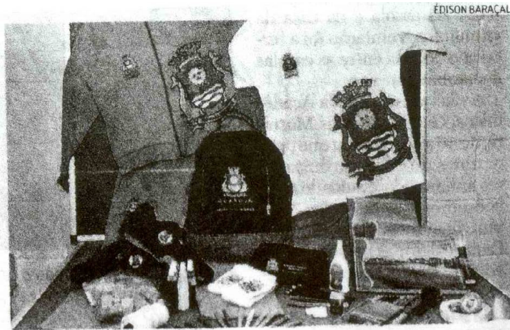
Os 34 mil alunos da rede municipal receberão o kit durante a semana

No Ensino Infantil, além do kit tradicional, haverá também colas coloridas, caixa de giz de cera, massa para modelar, fita adesiva, barbante e um "monta tudo" com 48 peças.