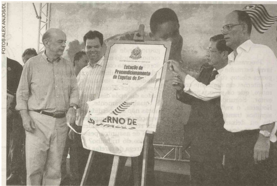
Em Santos, o governador José Serra, acompanhado de deputados e prefeitos, do embaixador do Japão no Brasil, inaugurou a Estação de Precondicionamento de Esgoto, que receberá todo o esgoto coletado nas cidades de Santos e São Vicente, na região do Orquidário

A terceira obra inaugurada ontem pelo governador foi a Estação de Tratamento de Esgoto (ETE), em Vicente de Carvalho, na cidade de Guarujá, que beneficiará nove bairros do Distrito.